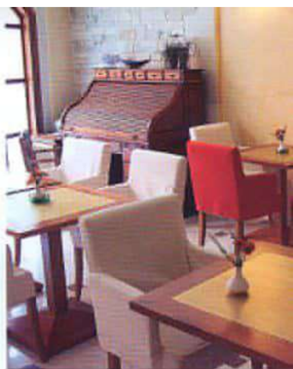
Ο χώρος του πρωινού

λαρισιοί. Φτάνετε στην πλατεία Σαντριβάν και βλέπετε όλη την ιστορία της πόλης, τις βενετσιάνικες και τις τουρκικές επιρροές. Αφήνετε το δεξιά κομμάτι της προκυμαίας για αργότερα, αφού εκεί βρίσκονται ενοικιασμένες από τις πιο γουστιαίες επιλογές που έχει η επισκέπτης στη Χανιά, και πεις αριστερά, προς το φρεσιό Φιριά. Σου κάνει εντύπωση το μπουκάλι με τη ρυζή και τα πατηράκια μπροστά σε κάθε μαγαζί. Μπορεί να μην το επιτρέπει η αυστηρή κρητική φιλοξενία αλλά τα μάσκεται για. Στο πιο «αξεδουκατιστό» ήμισυ κομμάτι της Κρήτης, κάτι είναι κι αυτό. Παίρνεις ένα στενό αριστερά και βρίσκεσαι μπροστά στο βενετσιάνικο κτήριο του Ξενώνα. Ήταν από τη διακριτική πινακίδα, ανακαλύπτει την ημισοκή που η βιοτεχνική εσωτερική αυλή με την τετράγωνο κάκτο, το βοτανακότο διάπεδο και τη μεγάλη γλάστρα στα μέσσι. Μπαλκόνια με σιδερέιες ή τουρνιετένια κάγκελα και οροφές, όλα συγκλίνουν προς την αυλή, ενώ κάποιες σκάλες «αναμφισβητών» προς τους εξώστες.