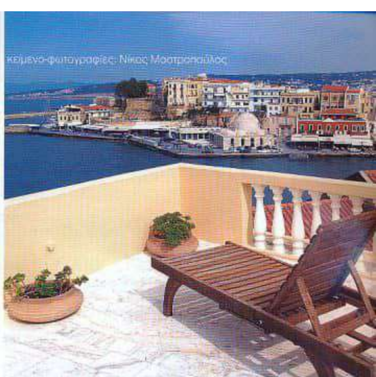
Η θέα από τη βεράντα του «Casa Delfino»