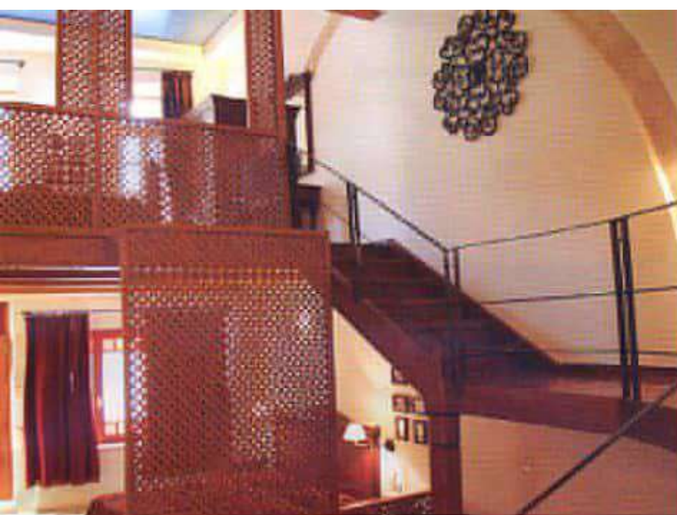
Τα καλύτερά μας από τις σουίτες